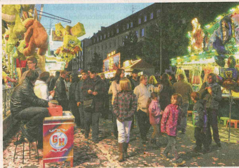
Kirmes am Sonntag, 30.09.2012 - Herbstkirmes

Der Kirmesbesuch findet am Montag, 28. September, statt. Einstiegsmöglichkeiten bestehen zu folgenden Zeiten: 13.45 Uhr Haltestelle am Awo-Seniorenzentrum „Schattige Buche“, Rheinbabenstraße 38; 14 Uhr Eingang Ernst-Löchelt-Seniorenzentrum, Bügelstraße 25. Der Aufenthalt auf der Kirmes ist von 14.30 bis 16.30 Uhr geplant. Die Ankunft auf dem Eigen ist dann wieder: